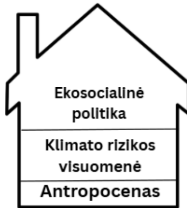
1 pav. Teorinės prieigos schema: namo analogija.